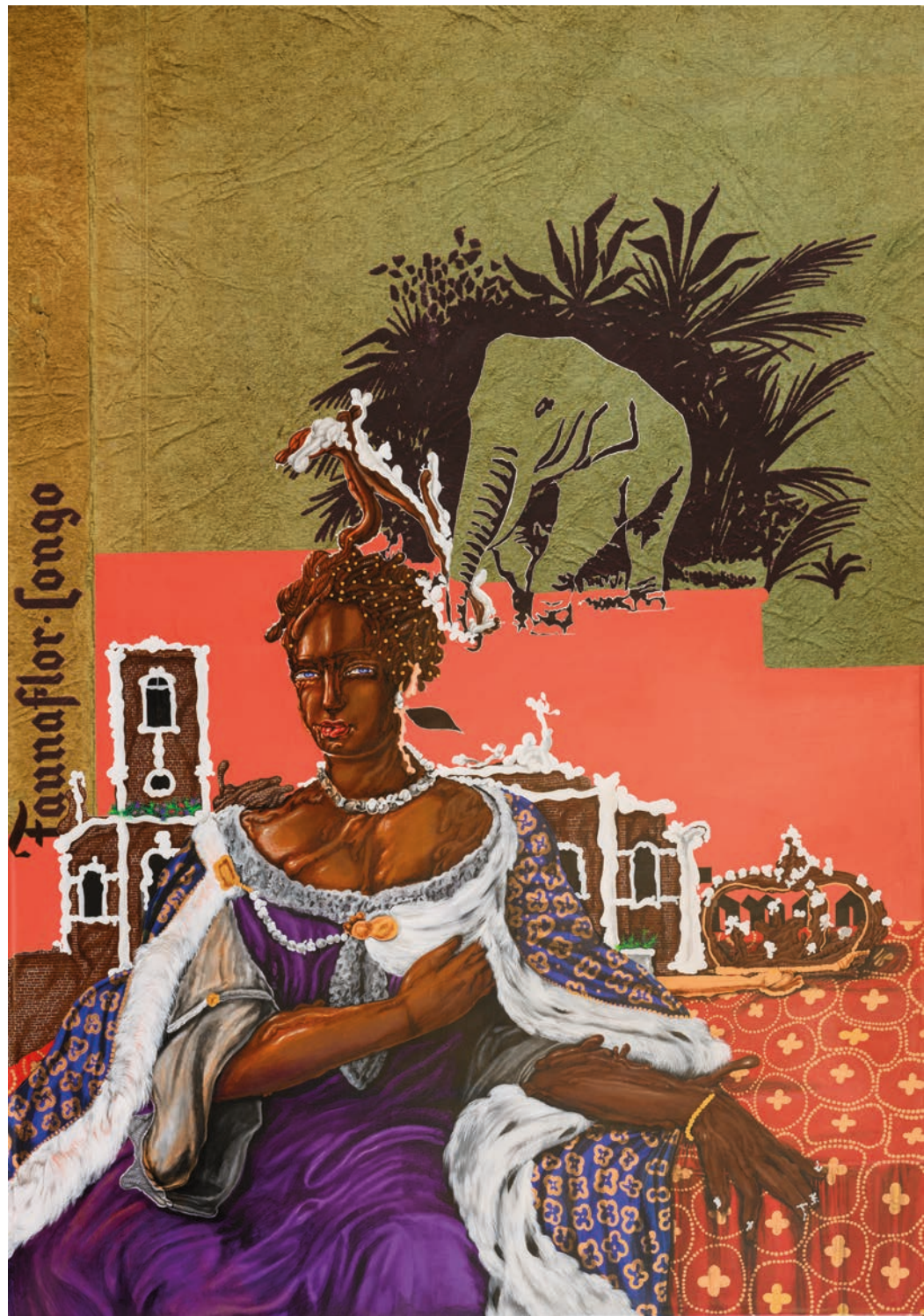
THE QUEEN, 2024 ACRYLIC PAINT AND PRINT ON CANVAS 200 x 140 CM