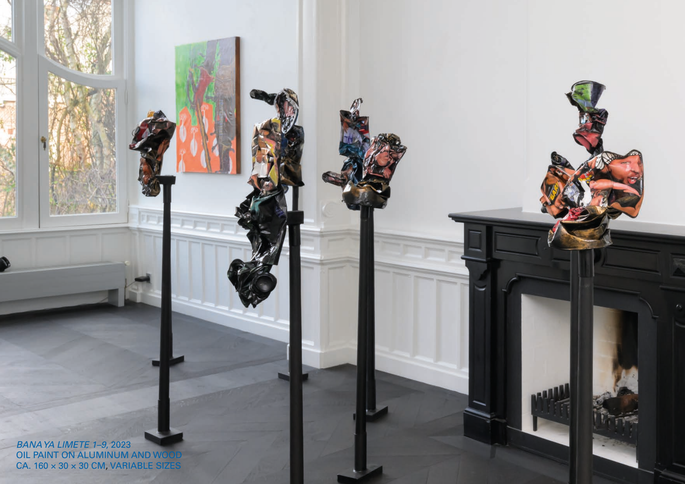
BANA YA LIMETE 1-9, 2023 OIL PAINT ON ALUMINUM AND WOOD CA. 160 x 30 x 30 CM, VARIABLE SIZES