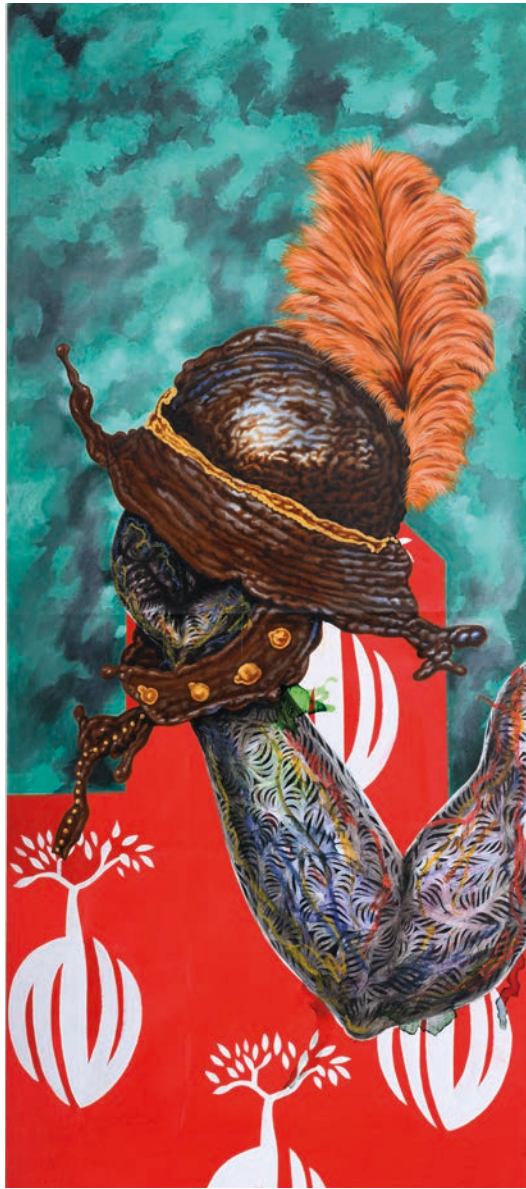
STEEL SKULL , 2024 MIXED MEDIA ON CANVAS 100 x 44,5 CM