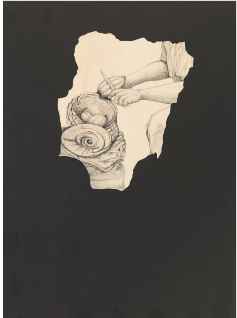
WINDOWS , 2023 INDIA INK ON WOOD 100 x 120 CM