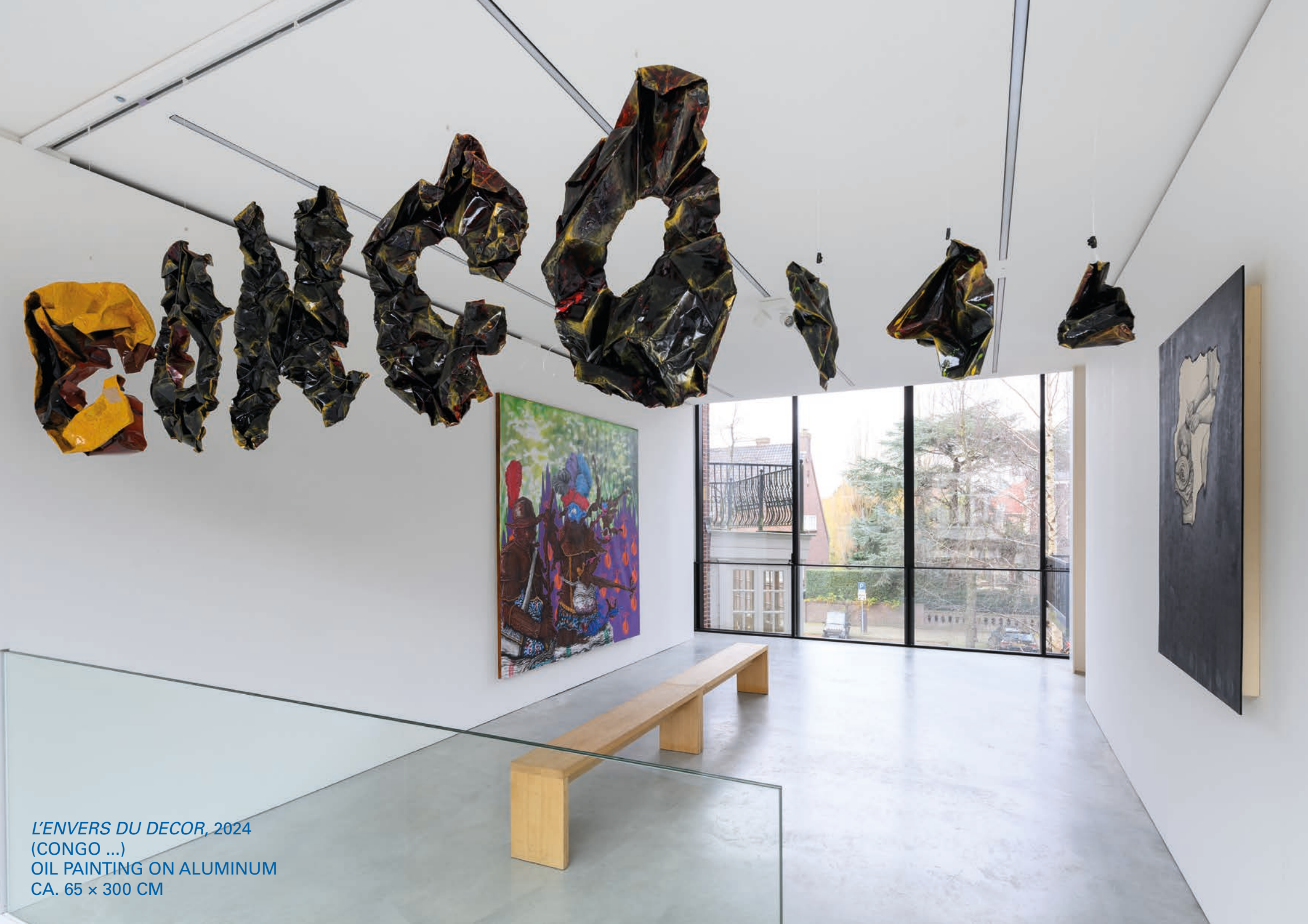
L'ENVERS DU DECOR, 2024 (CONGO ...) OIL PAINTING ON ALUMINUM CA. 65 × 300 CM