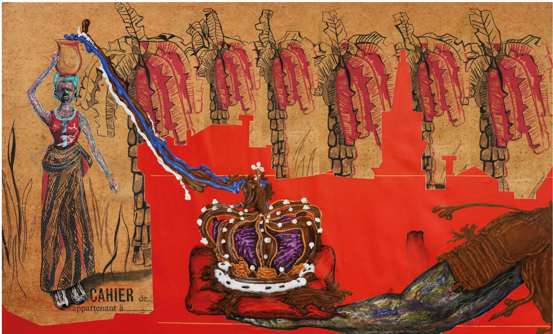
MY CROWN, 2024 MIXED MEDIA ON CANVAS 100 x 120 CM