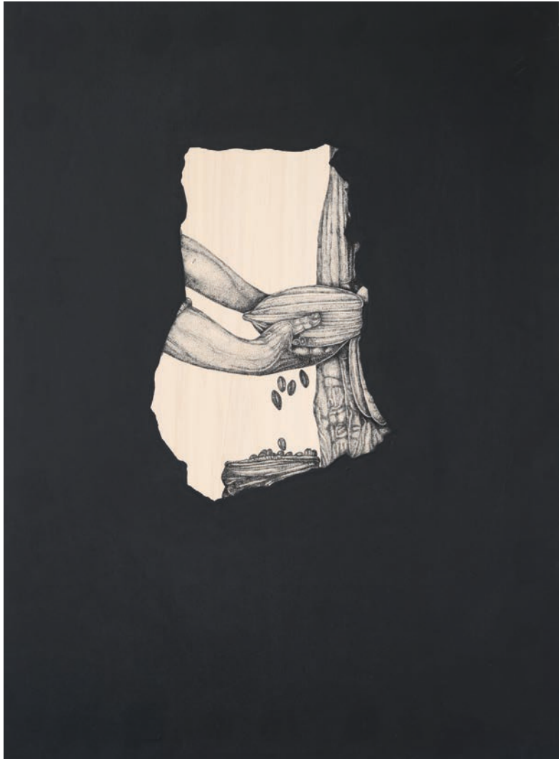
WINDOWS , 2023 INDIA INK ON WOOD 100 x 120 CM