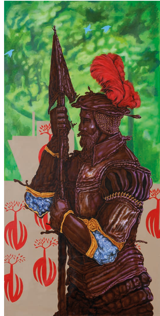
LOW PROFILE , 2024 ACRYLIC ON CANVAS 150 x 76 CM