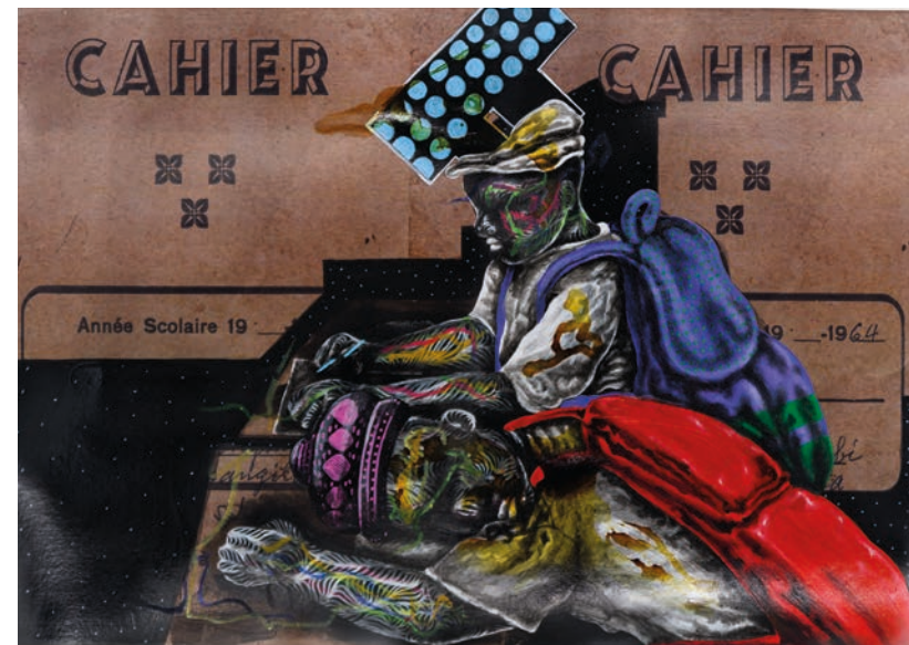
MY CLASS, 2024 MIXED MEDIA ON PAPER 30 x 42 CM