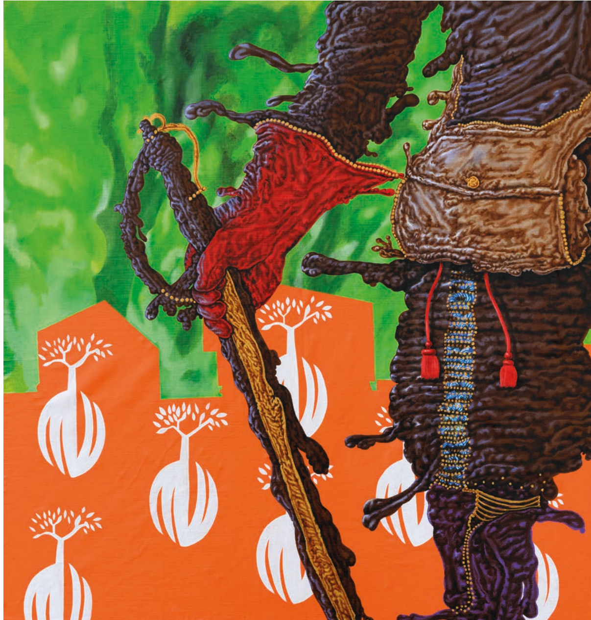
EXECUTIVE SWORD , 2024 MIXED MEDIA ON CANVAS 101 x 96 CM