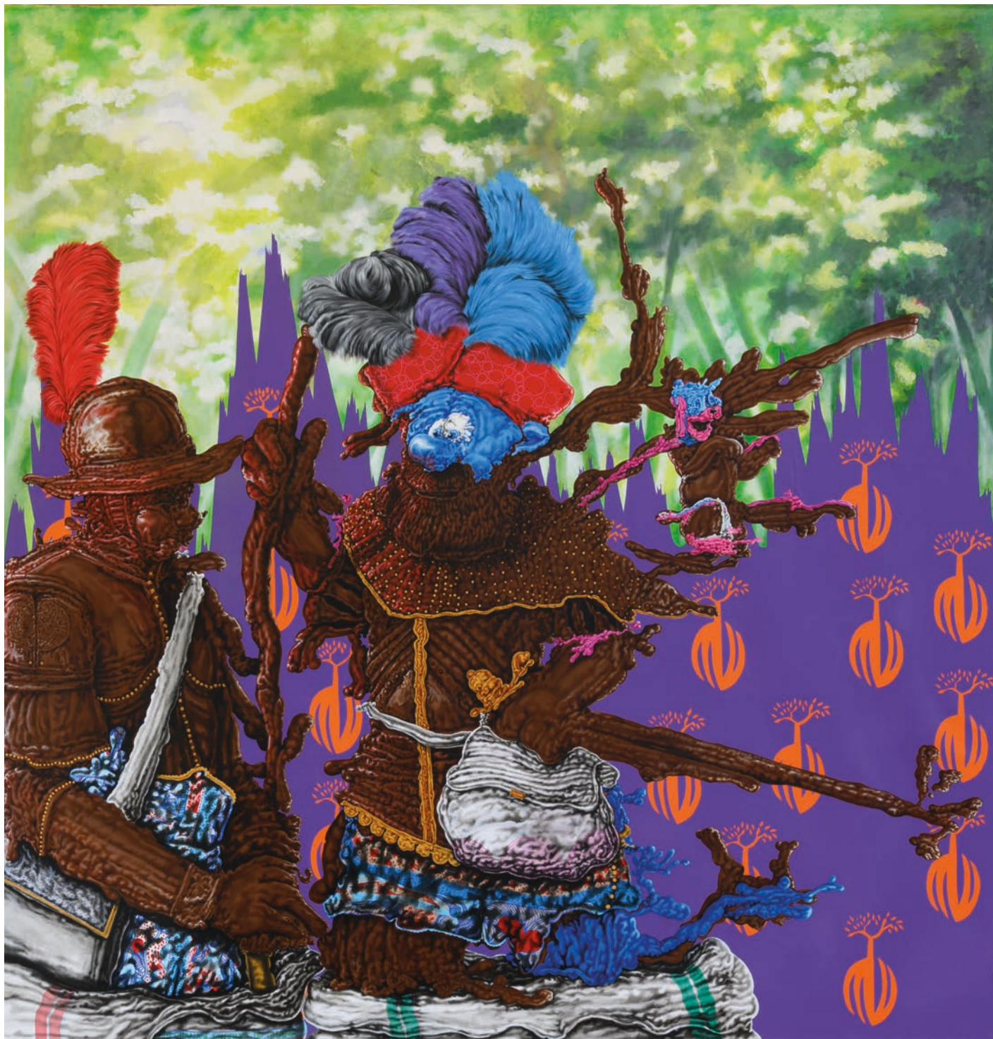
TALK TO THE CARTOON, 2024 MIXED MEDIA ON CANVAS 216 x 210 cm